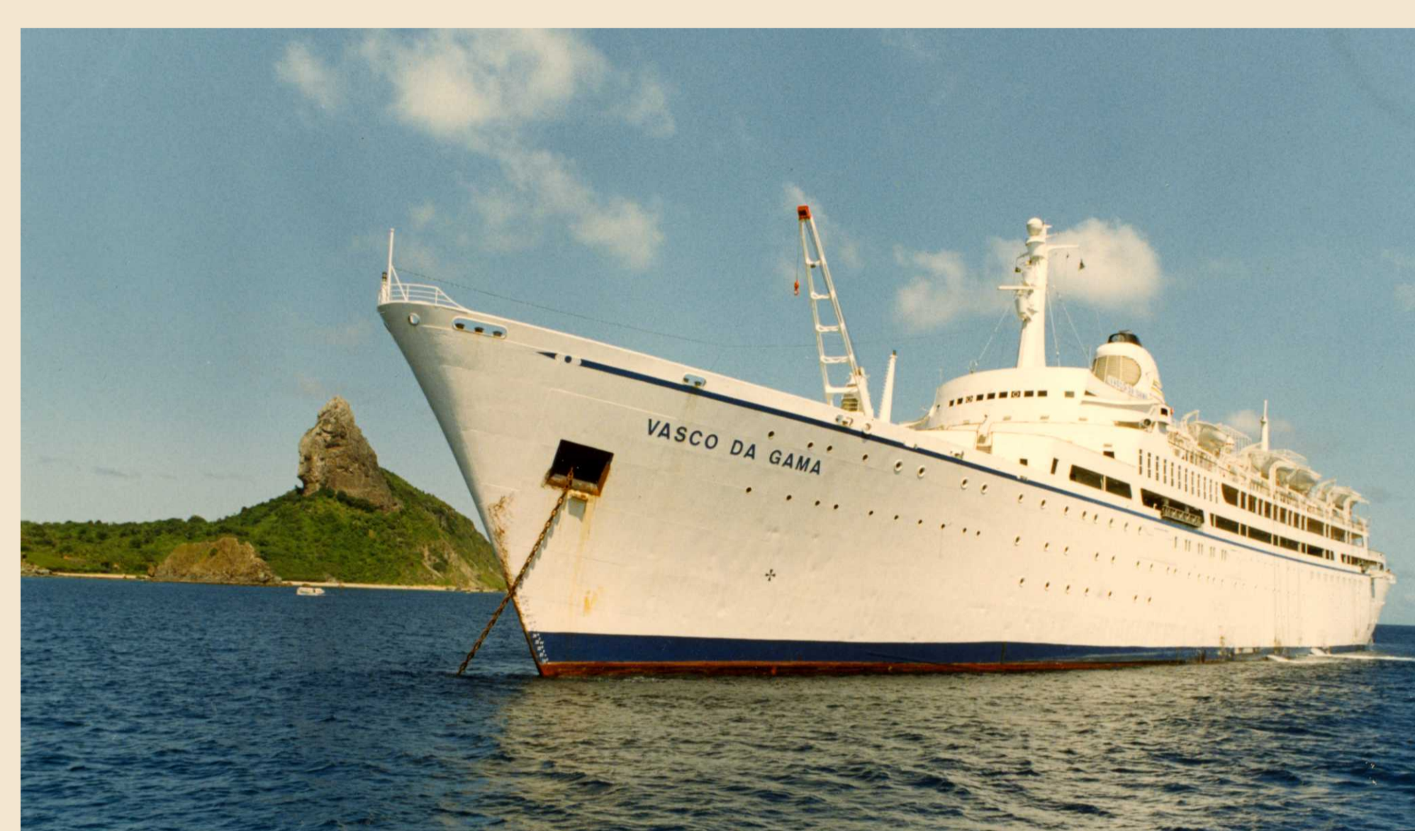
Vasco da Gama.

Usados sobretudo como único meio de comunicação entre o arquipélago e o continente, os navios foram importantes no transporte de gêneros, pessoas, correspondência e, nos tempos atuais, como lazer, com o advento dos cruzeiros marítimos.