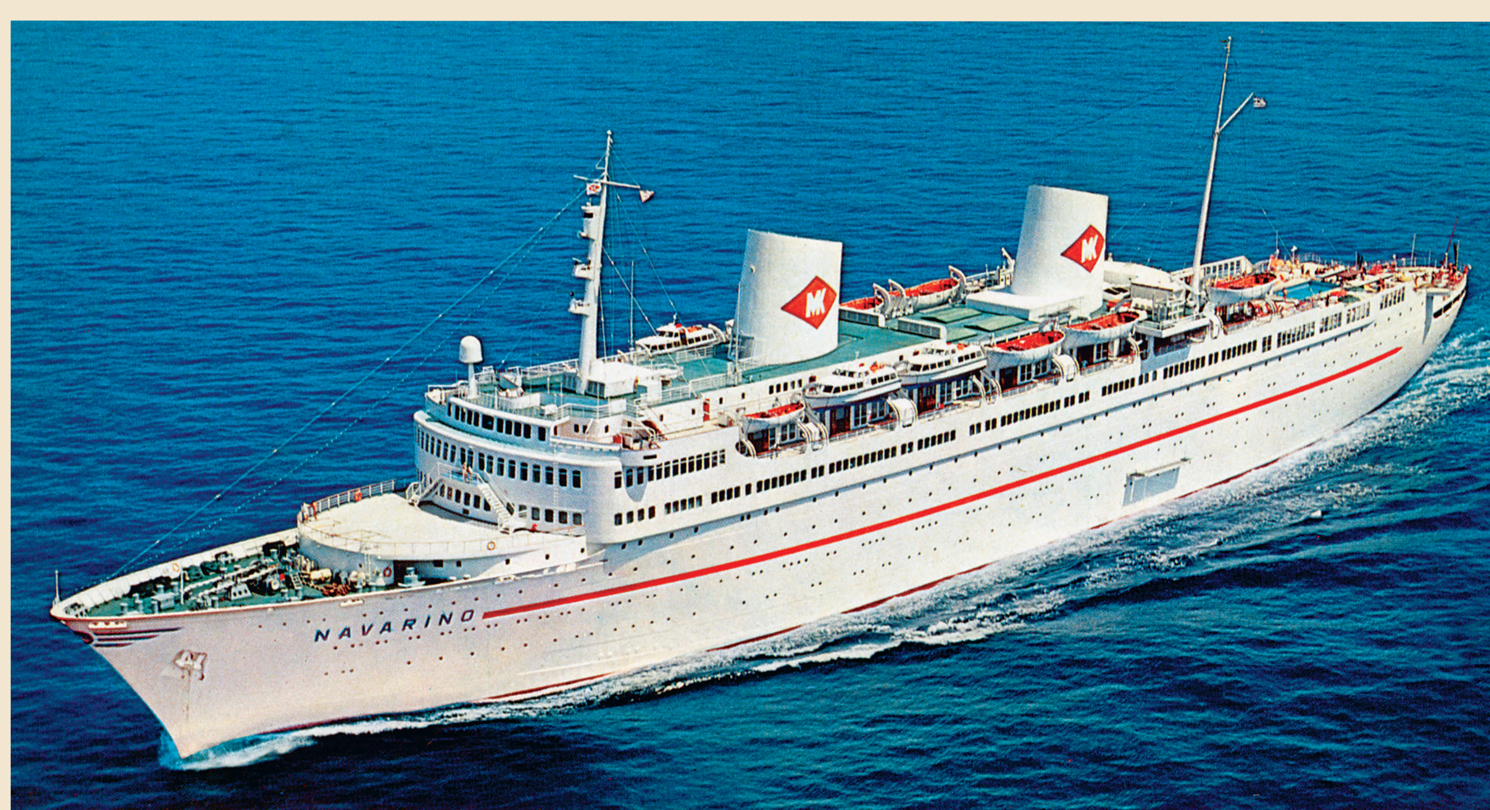
Navio Navarino, que fez o 1º cruzeiro marítimo com destino a Fernando de Noronha, 1981.

A partir de 1990, navios transatlânticos passaram a cumprir temporadas turísticas na ilha de Fernando de Noronha: Funchal, Vasco da Gama, Princess Danae, Blue Dreams, Pacific, Rembrandt, Orient Queen, Ocean Dream, entre outros.