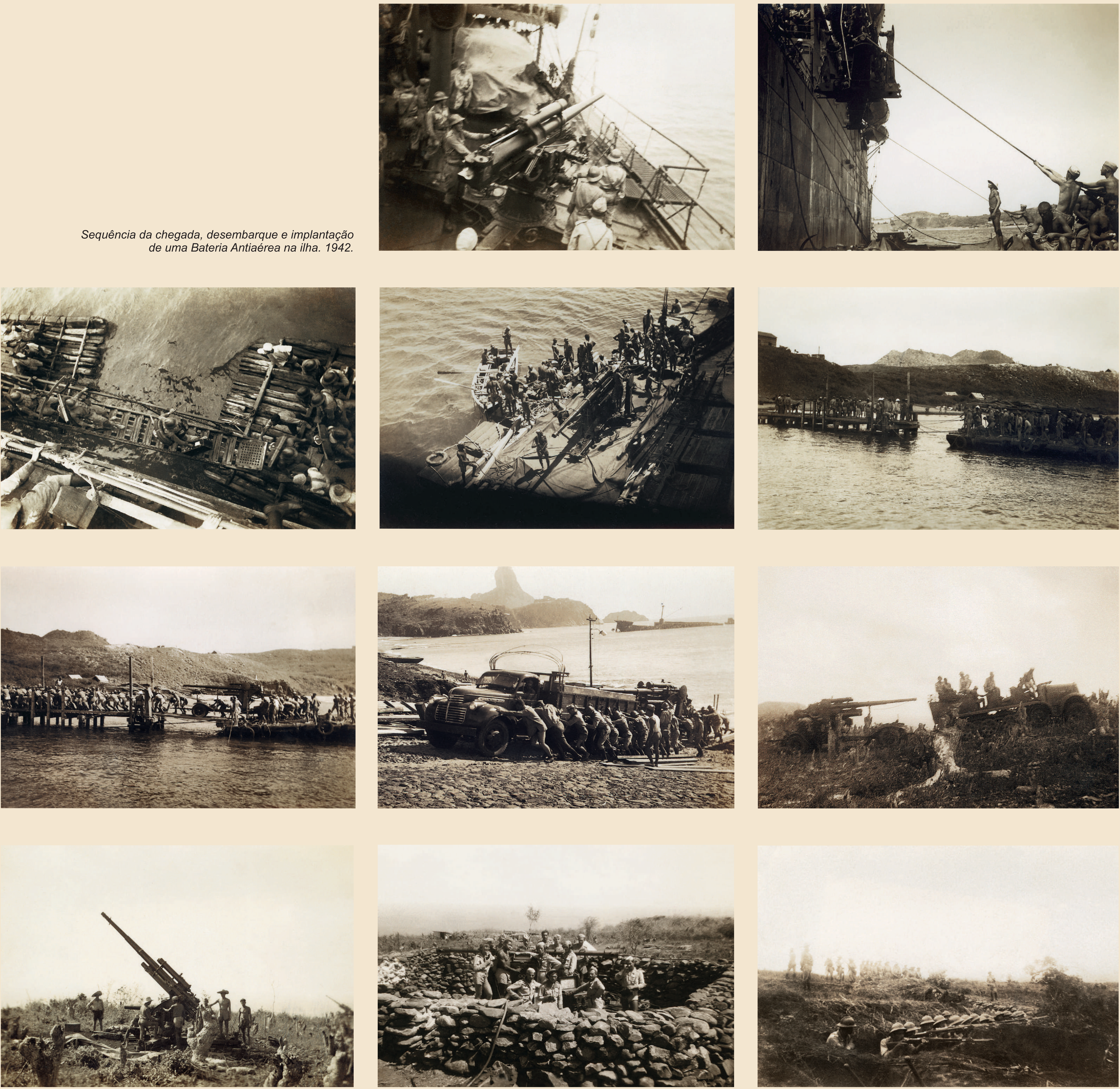
Sequência da chegada, desembarque e implantação de uma Bateria Anti-aérea na ilha. 1942.