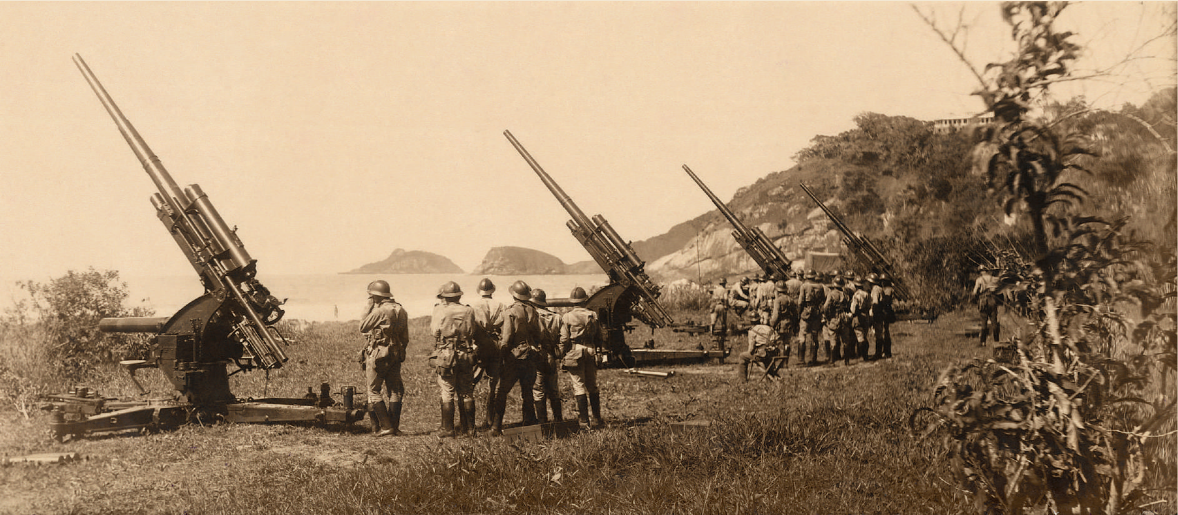
Canhões Crupp – Anti-aéreos, de fabricação alemã, do 1/2º Regimento de Artilharia Anti-aérea.

Homens e máquinas ocuparam toda a ilha, voltando-se para todos os lados de onde poderia vir o perigo. No passado, defendia-se o mar dos invasores. E no século XX tanto o mar como o ar, para que navios e aviões em combate fossem