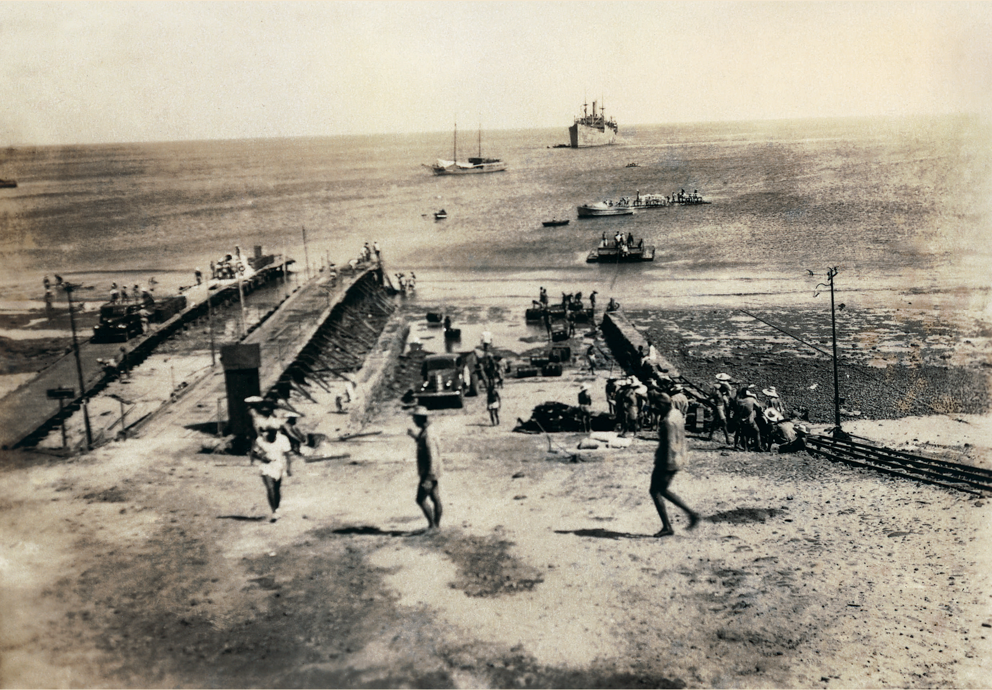
Molhe no Porto de Sto. Antônio. Construído pelos Pontoneiros de Itajubá em 1942, para atracação de navios.

Defense system of the 20th Century | Mixed Detachment of the Second World War