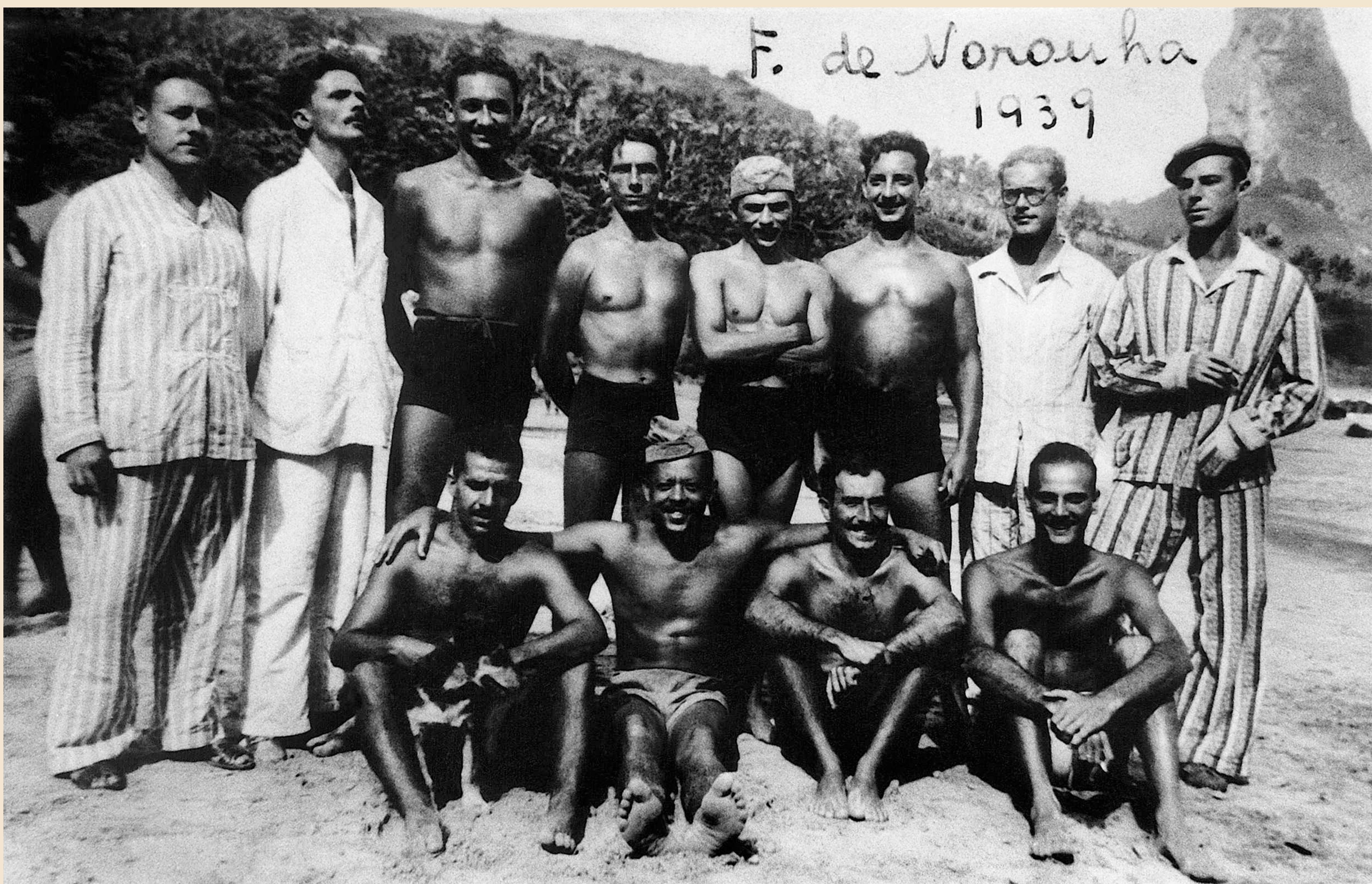
Presos políticos junto a presos comuns (estes identificados pela roupa em listras, usadas pelos presidiários), no alto da Floresta. 1939.

Em março de 1938 foi criada a Penitenciária Agrícola do Distrito Federal (PADF), na Vila de Dois Rios, Ilha Grande, Rio de Janeiro. Meses depois, cria-se a Colônia Agrícola de Fernando de Noronha, destinada à concentração e trabalho de indivíduos considerados perigosos à ordem pública ou suspeitos de atividades extremistas, oriundos de todo o País.