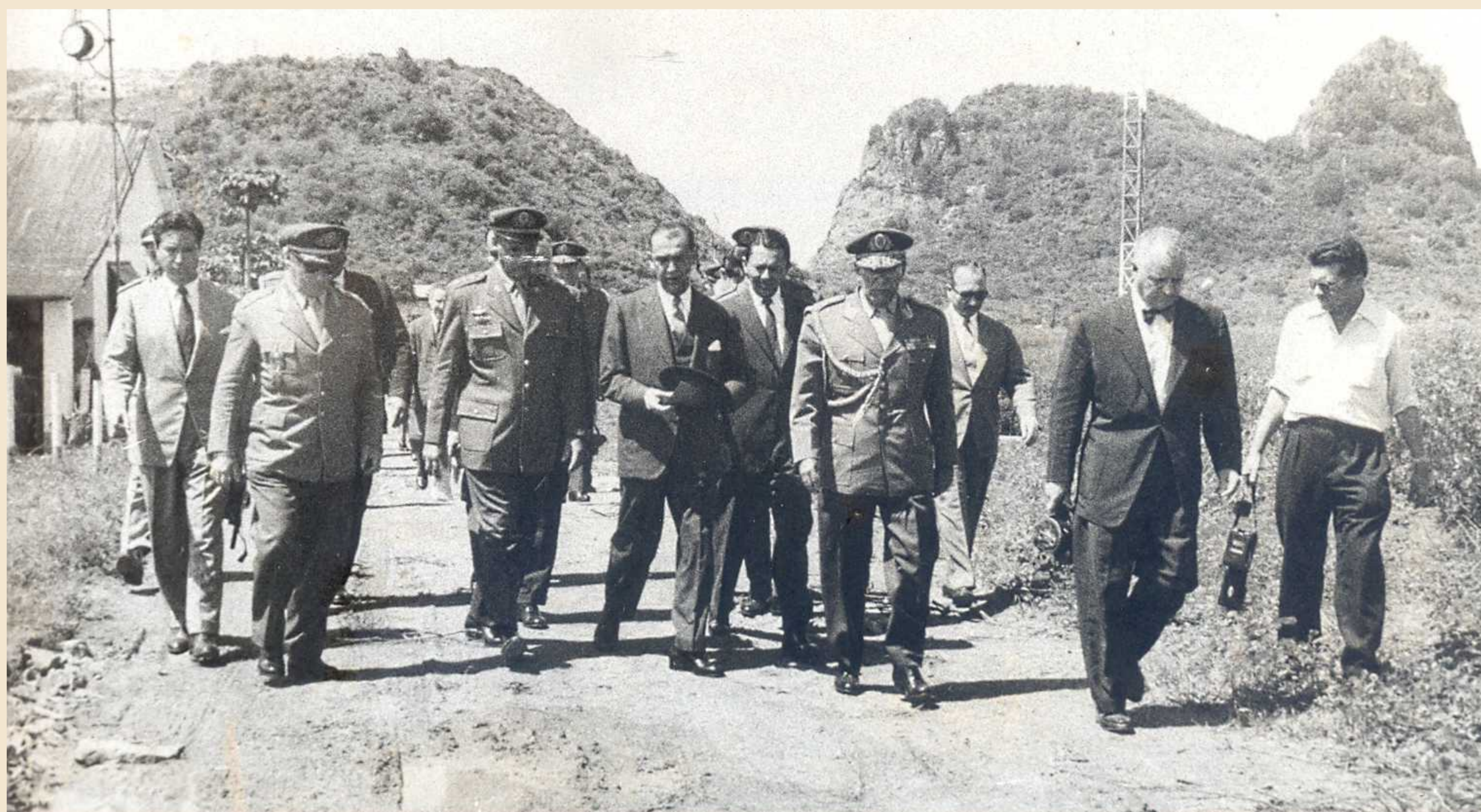
Juscelino em visita ao Posto de Observação de Teleguiados.