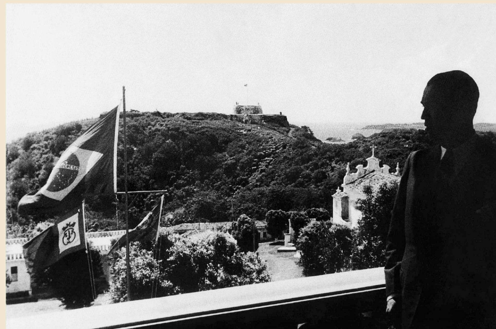
Juscelino Kubitschek de Oliveira, 1º Presidente da República a visitar Fernando de Noronha, o fez para assinar o Acordo com os americanos e consequente instalação do Posto de Observação de Teleguiados.