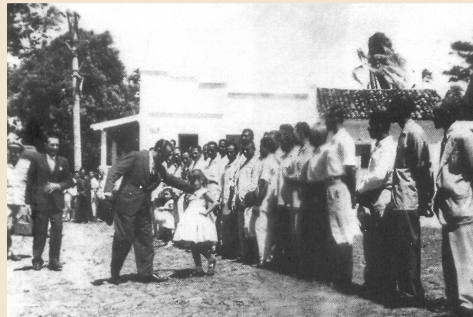
Juscelino cumprimenta a população, na Vila dos Remédios, antes de assinar os acordos com os americanos.