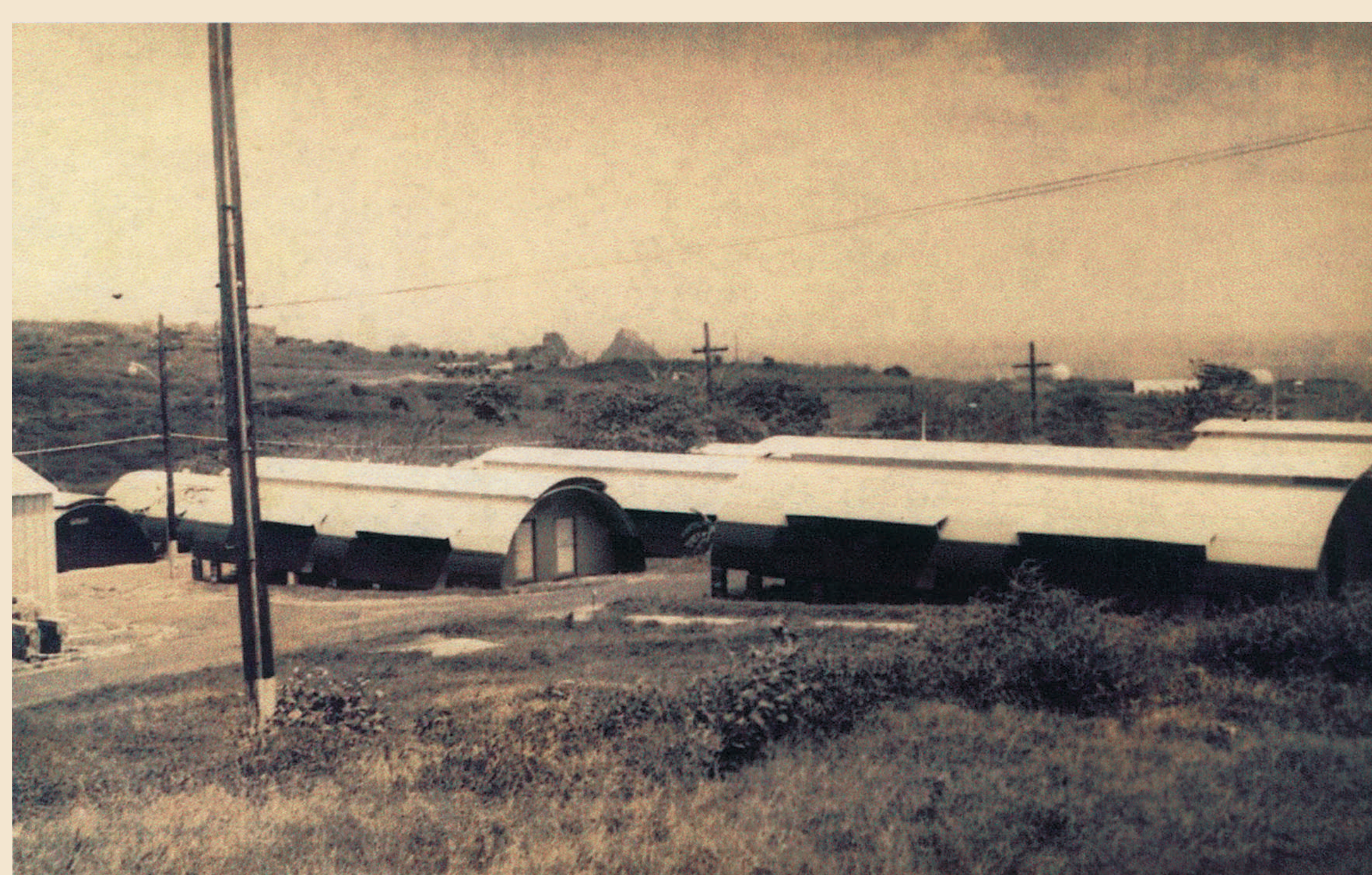
Alojamentos do Posto de Observação de Teleguiados - POT.