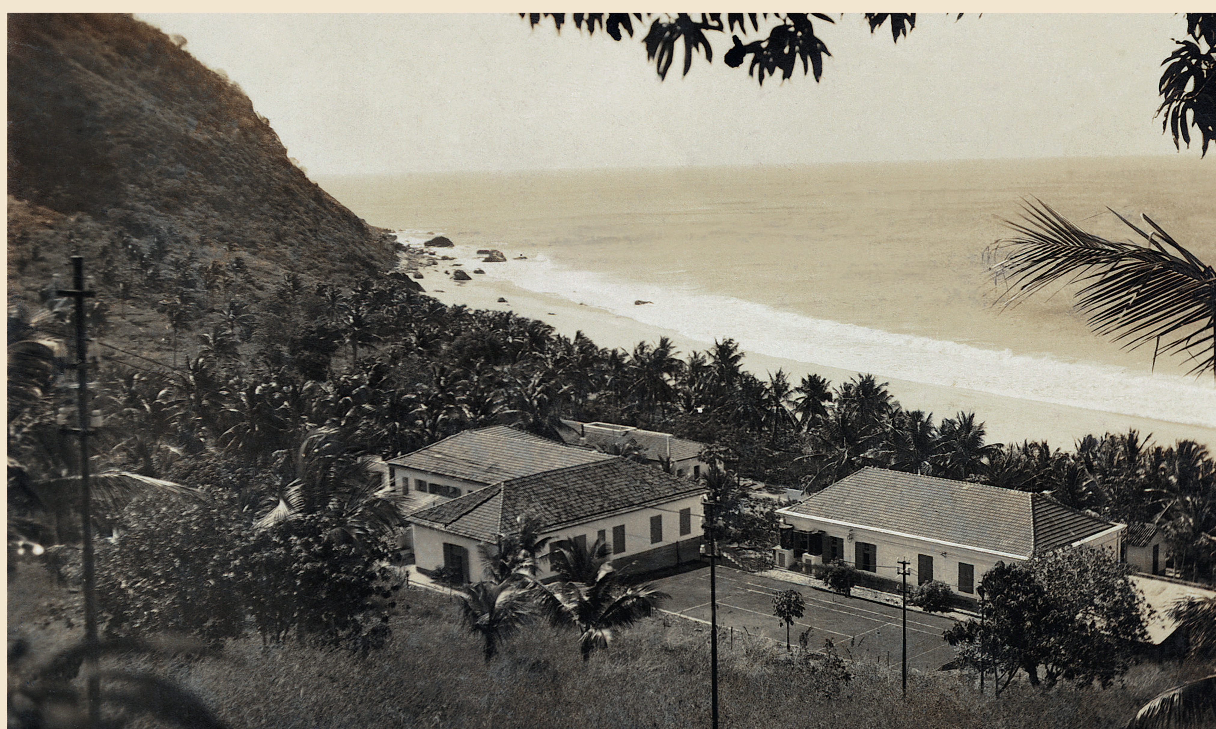
Vista parcial da Vila da Italcable, implantada em 1925, na praia da Conceição, com uma quadra esportiva como área de lazer.

A Compagnie Italiana dei Cavi Telegraphie Sottomarini - ITALCABLE, solicitou licença para instalar-se em Fernando de Noronha em 1922, inaugurando - na Praia da Conceição - em 1925 sua estação cabográfica operando com instrumentos potentes, executando a retransmissão automática de comunicação transoceânica e tendo sua energia gerada por cata-vento, precursor da energia eólica. Por essa